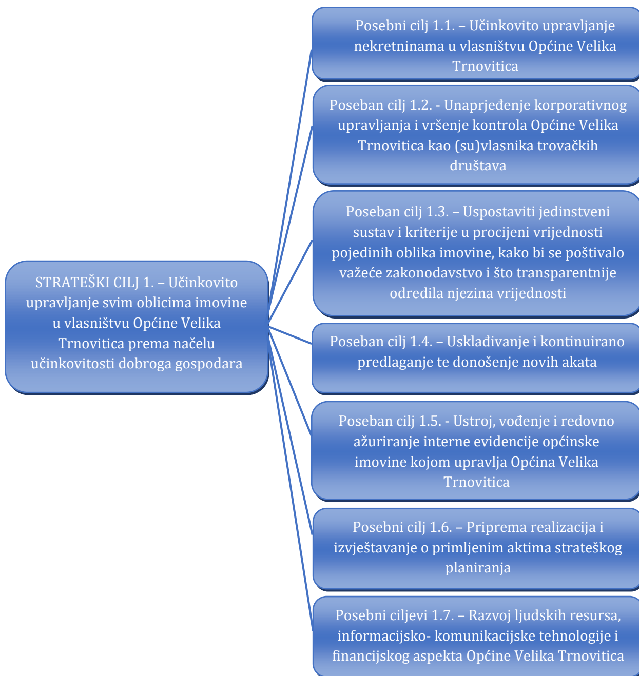
Slika 2. Kaskadiranje strateškog cilja upravljanja općinskom imovinom