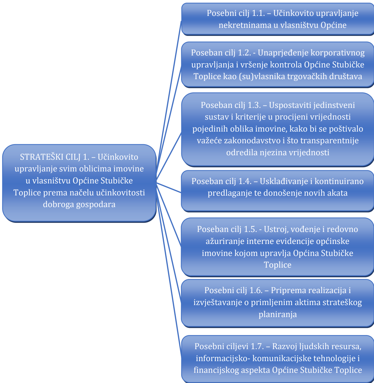
Slika 2. Kaskadiranje strateškog cilja upravljanja općinskom imovinom